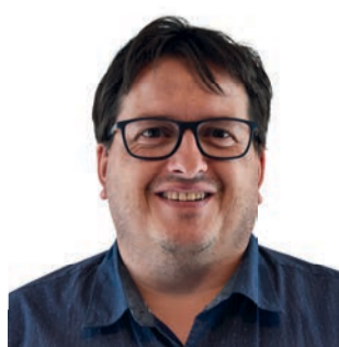
Bart Gerits Studiedienst, Geel