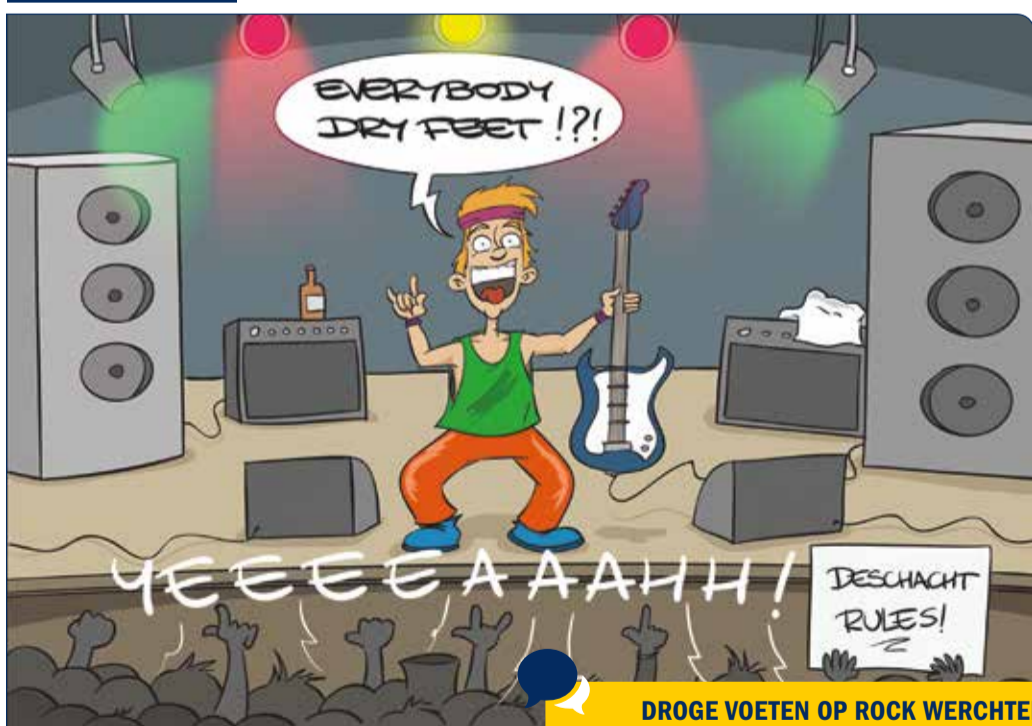
DROGE VOETEN OP ROCK WERCHTER DANKZIJ SUPERBETON EN DESCHACHT, lees meer op p1-2