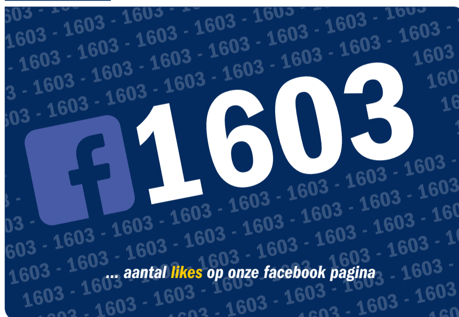
... aantal likes op onze facebook pagina