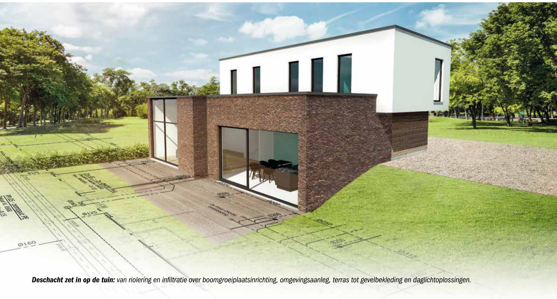
Deschacht zet in op de tuin: van riolering en infiltratie over boomgroeiplaatsinrichting, omgevingsaanleg, terras tot gevelbekleding en daglichtoplossingen.