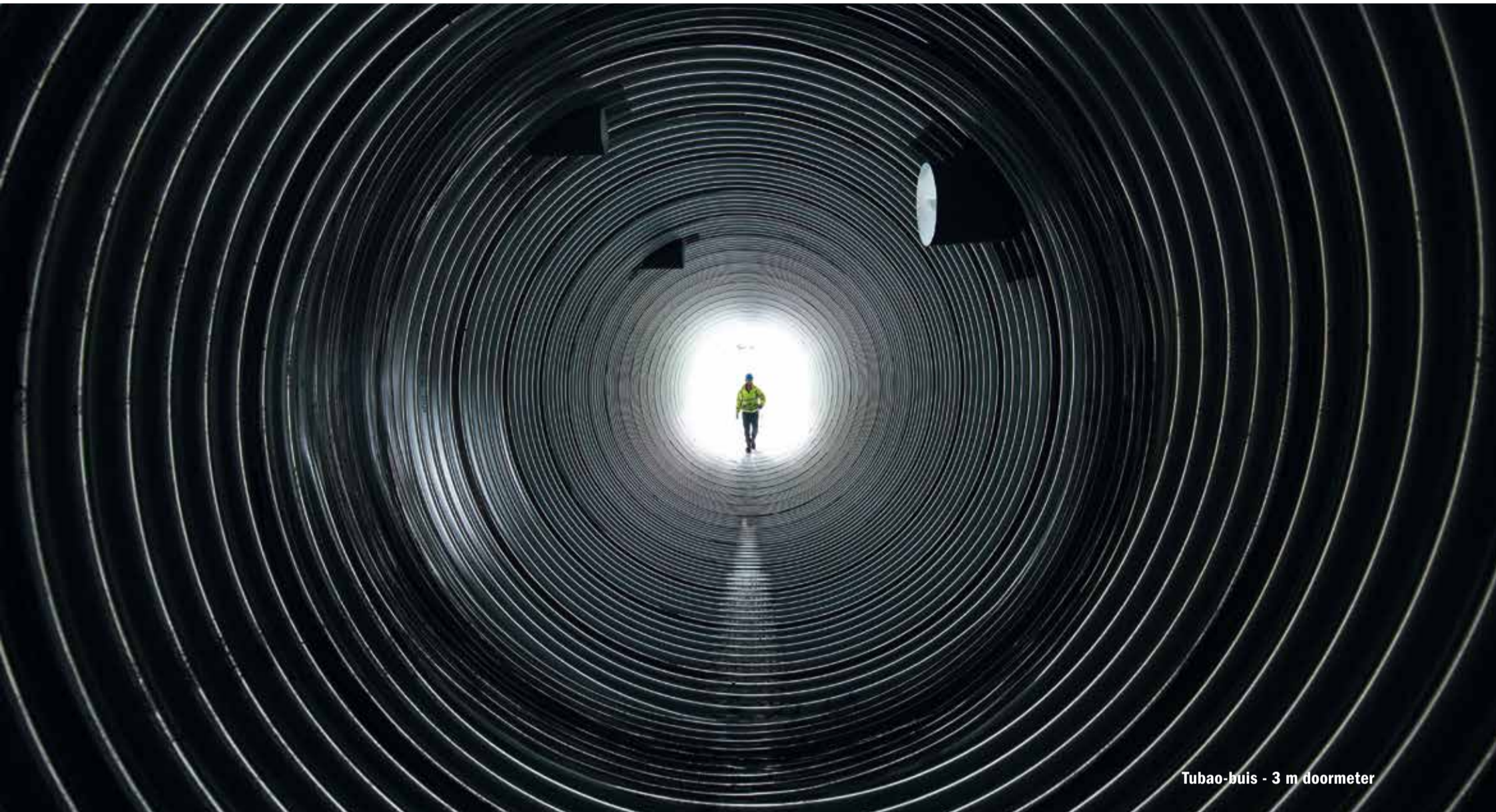
Tubao-buis - 3 m doormeter