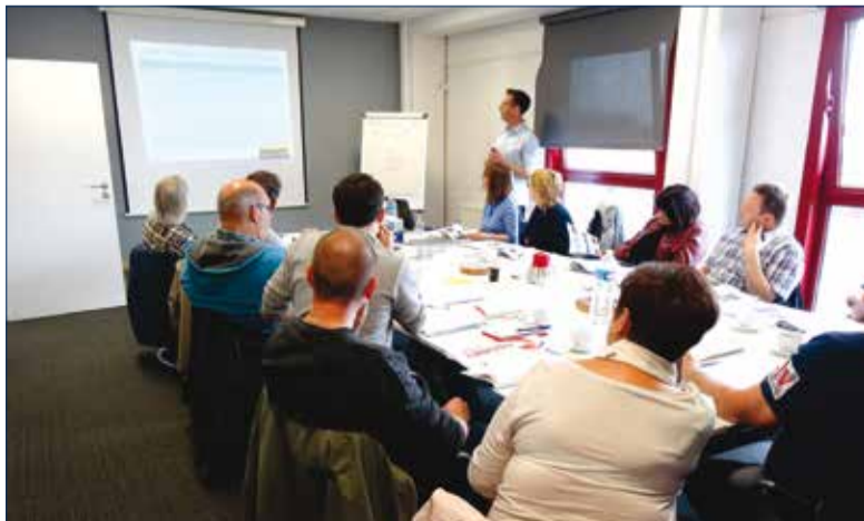
Opleiding van een twintigtal ingenieurs van de Service Public de Wallonie in Luik, op 19 en 26 april 2018.